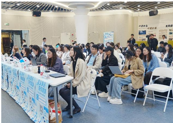
复旦大学校园宣讲会

金秋时节，FineToday 菲婷丝在中国正式启动成立后的首次校园招聘，不仅为集团未来发展储备新生力量迈出关键一步，更与年轻消费者建立了深度情感联结。两场校园宣讲会以“定义美好，菲你莫属”为主题，精准覆盖了复旦大学和上海交通大学两所顶尖高校，吸引 160 余位学生到场。